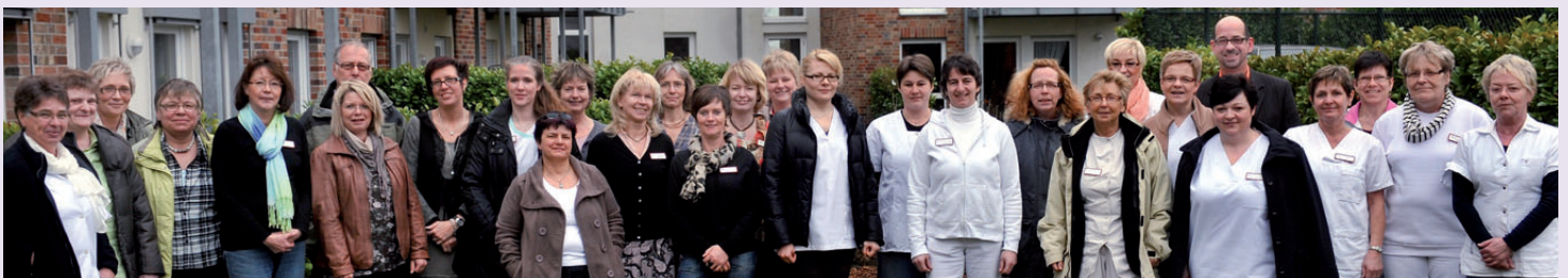
Das Klever Pflegeteam