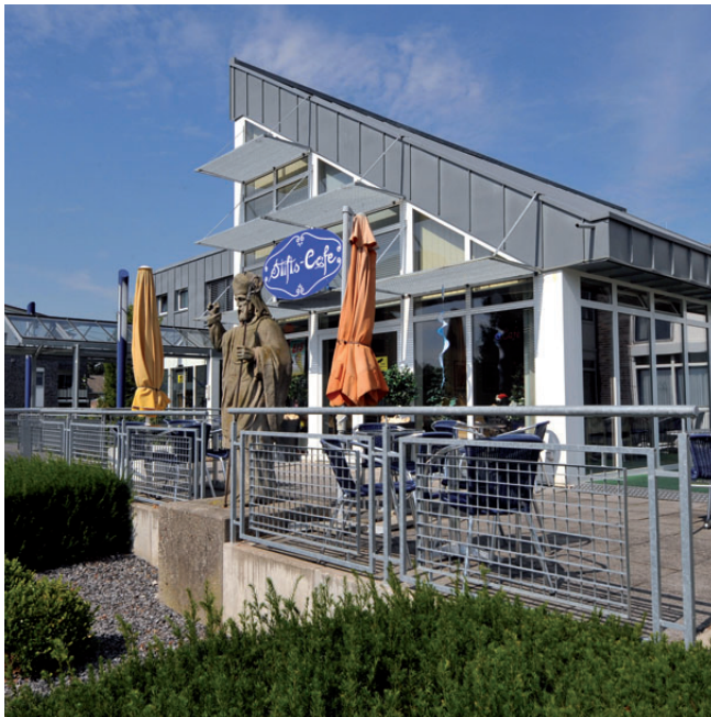
Beispiel 2: St.-Martinus-Stift in Elten