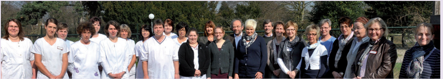
Das Pflegeteam für den Bereich Goch/Uedem