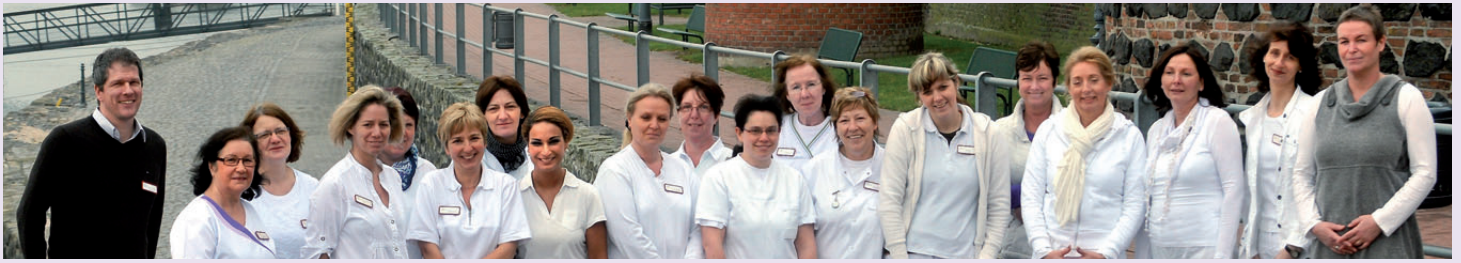
Das Caritas-Pflegeteam aus Rees