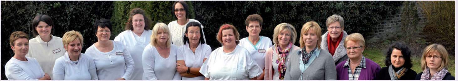
Das Team der Mobilen Pflege für Kalkar und Bedburg-Hau