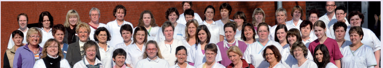
Das Team der Mobilen Pflege Emmerich am Rhein